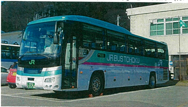
今回運行する当該車両