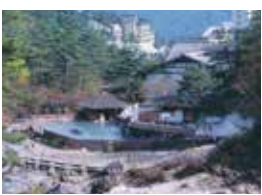
西の河原露天風呂