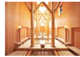
大滝乃湯 合わせ湯